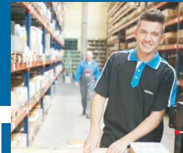
Fachkraft für Lagerlogistik (m/w)