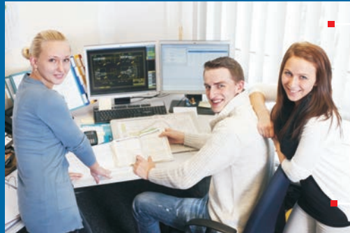
Technischer Produktdesigner (m/w)