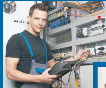
Elektroniker für Betriebstechnik (m/w) mit Verbundstudium Elektrotechnik

Unser Angebot: Erstklassige Berufsausbildung , auch in Kombination mit einem Verbundstudium