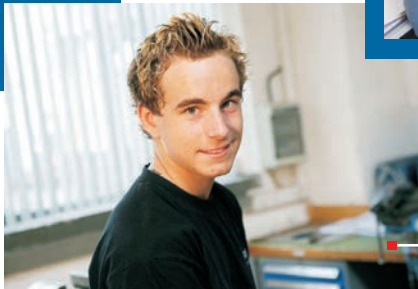
Fachinformatiker Anwendungsentwicklung (m/w)