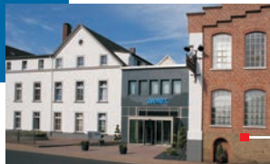
ANDRITZ Sundwig GmbH Hemer