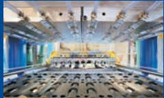
Tool and mould construction and manufacturing